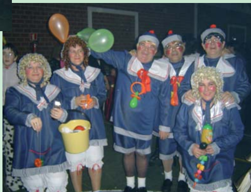
TERCER PREMIO DE GRUPO 2005. BEBES.