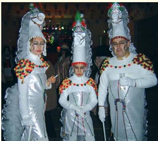
PRIMER PREMIO INDIVIDUAL 2005. CABALLOS DE GALA.