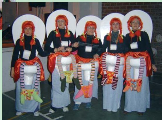
SEGUNDO PREMIO DE GRUPO 2005. GRUPO WC.