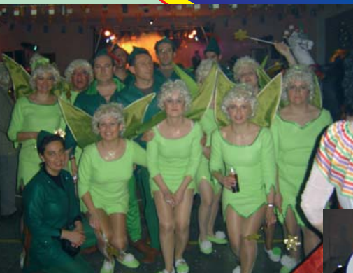
PRIMER PREMIO DE GRUPO 2005. CAMPAÑILLA p PETER PAN