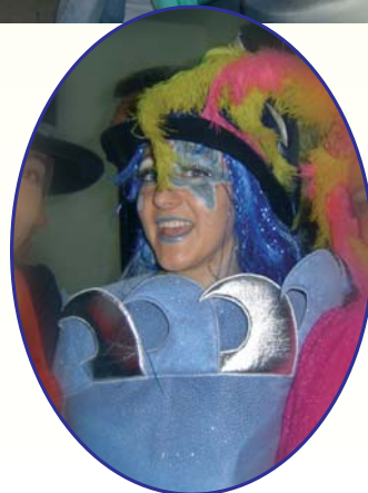
TERCER PREMIO INDIVIDUAL 2005. FONDO DEL MAR.