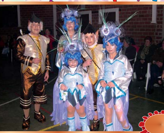
Tercer Premio de Grupo 2007 "DUENDES GALÁCTICOS"