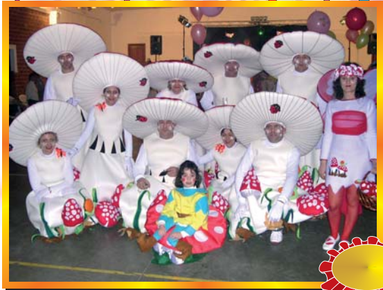
Primer Premio de Grupo 2007 "LAS SETAS"