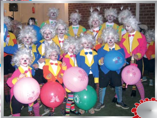
Segundo Premio de Grupo 2007 "LOS DUENDES DEL GLOBO"