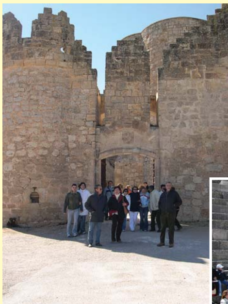
Visita al Castillo de Belmonte