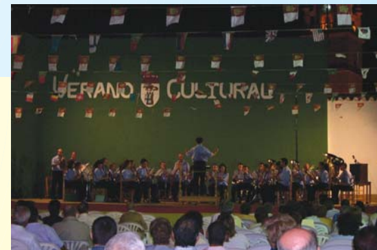
Concierto de la Banda Municipal de La Gineta