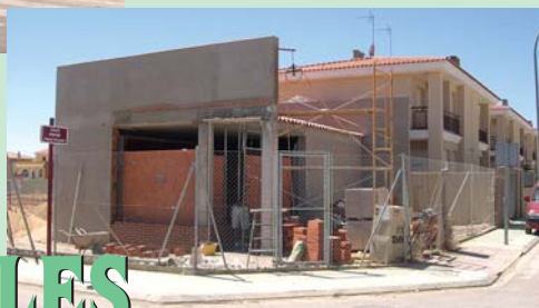
Obras del campo de fútbol