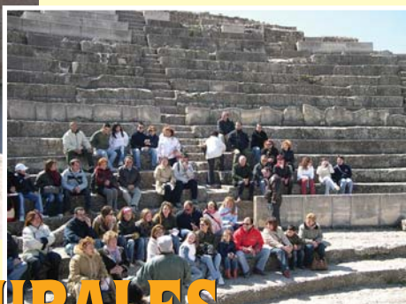
Visita a Monasterio de Ucles