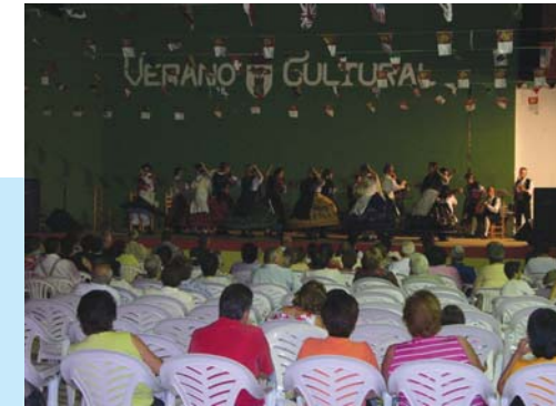
Amas de casa