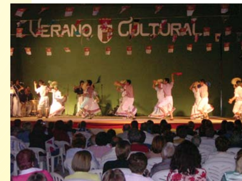
Grupo de Danzas Internacionales de Ecuador