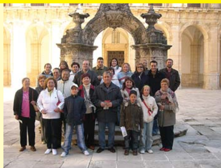
Visita a Monasterio de Ucles