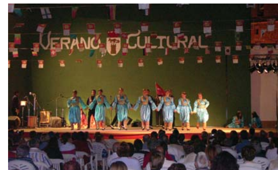
Grupo de Dabzas Internacionales de Turquía