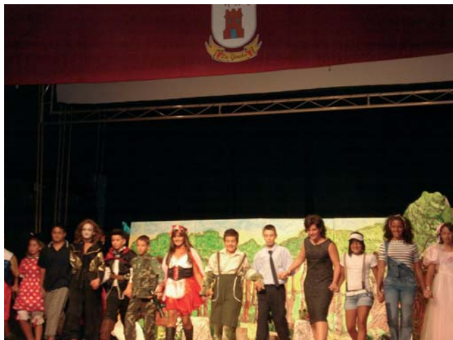
Teatro infantil de la Asociación AMPA, de la Gineta.