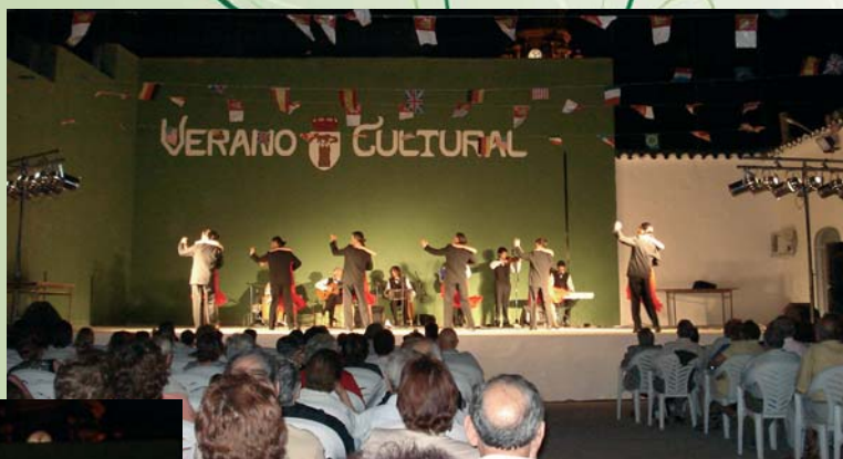
Bailes internacionales el Trébol de Argentina.