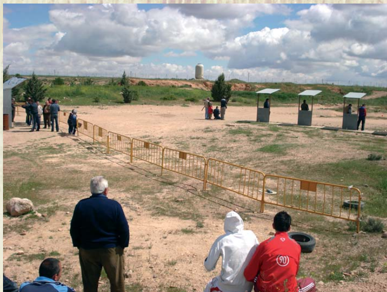
Campeonato de España de galgos.

08'00 h: CARRERA DE GALGOS , en el canódromo Municipal de San Juan.