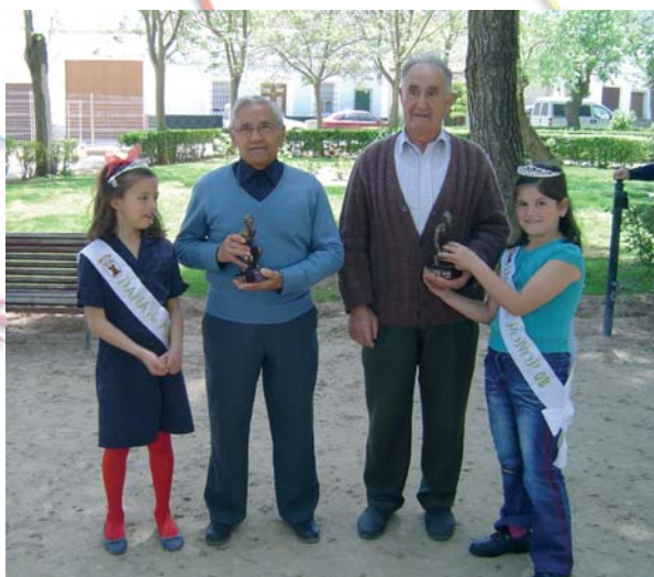
Campeones de Petanca, mayo 2008.

12`00 h: Final de Petanca , en la Glorieta Amalio Fernández.