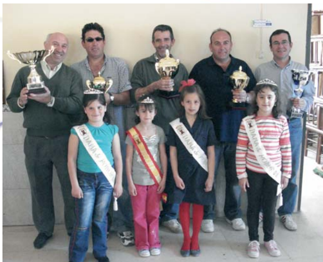
Campeones de Bolinche, mayo 2008.