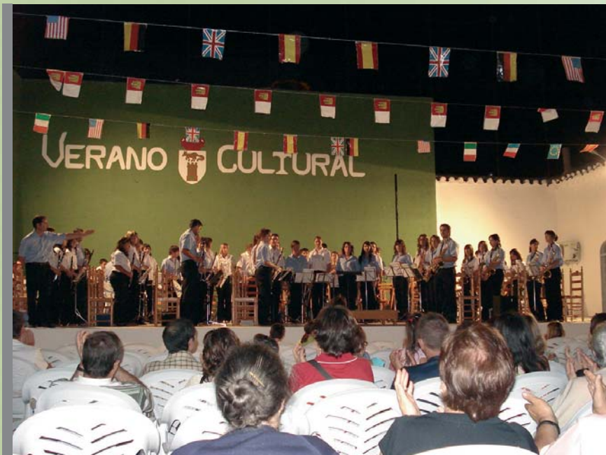
Encuentro de Bandas de Música La Gineta-Villalgordo del Júcar