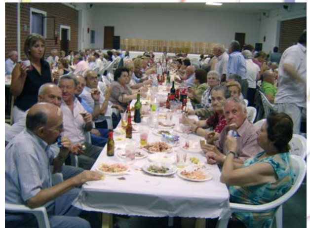
Invitación de jubilados septiembre de 2007.