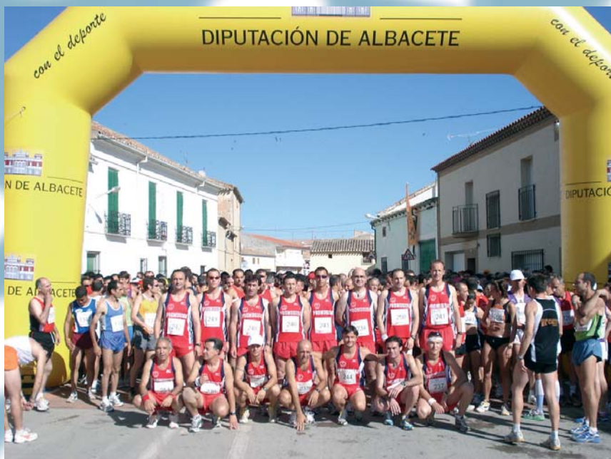
Primera carrera popular de 10.000 metros. La Gineta 2008.