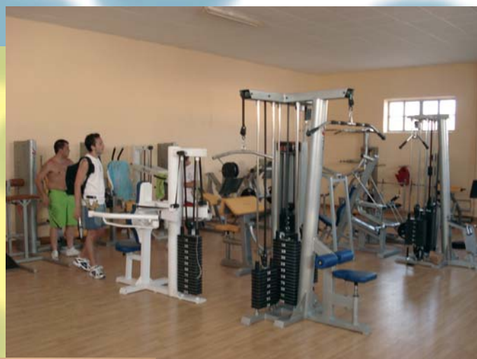
Adecuación del gimnasio municipal.