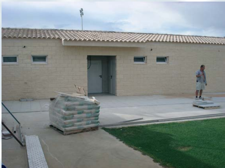
Aseos nuevos en el campo de fútbol.