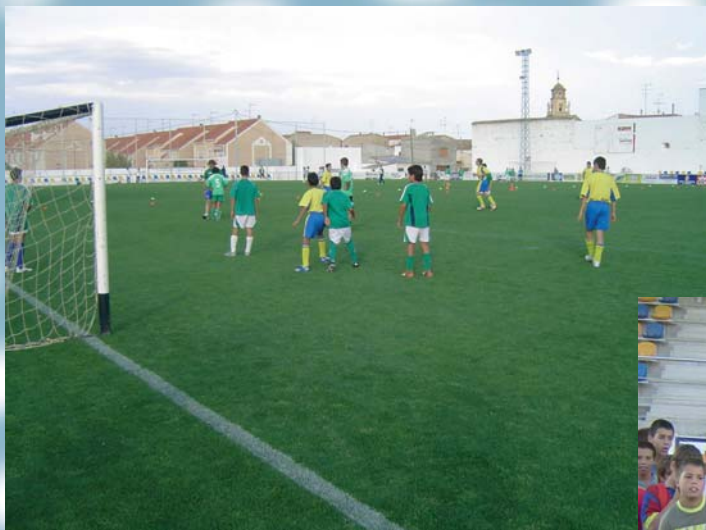
Escuela de Futbol Base.