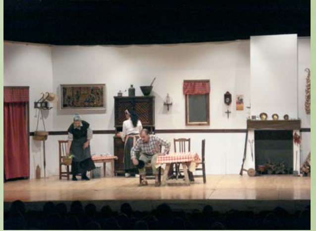
Grupo de teatro de la Asociación Cultural 4 Esquinas de la Gineta.