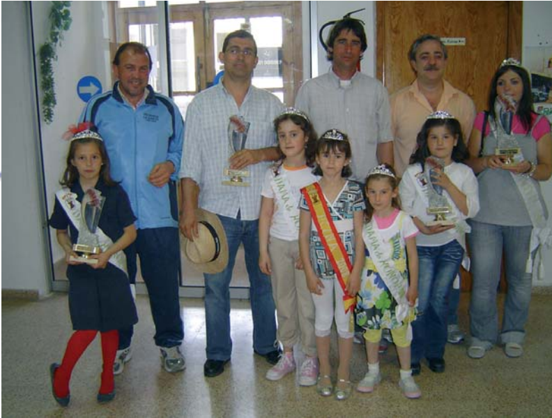
Campeones de Truque, mayo 2008.