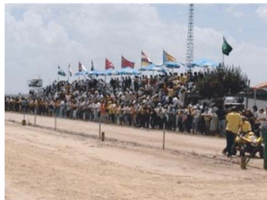
Adjudicada a la Gineta la celebración del XXI Campeonato nacional el 17/06/2007.