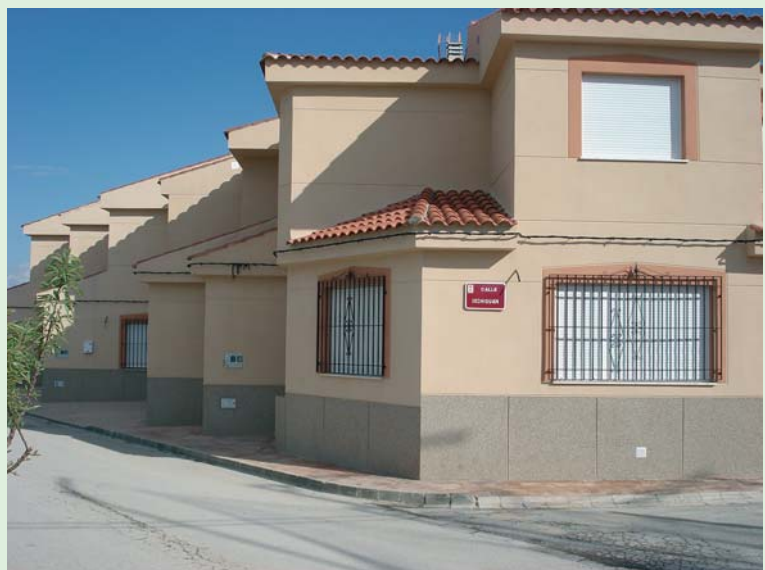
Imagen de las viviendas de protección oficial.