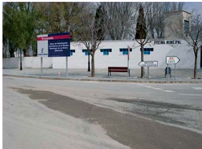
Obras de acondicionamiento