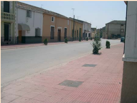
C/ Real y Plaza