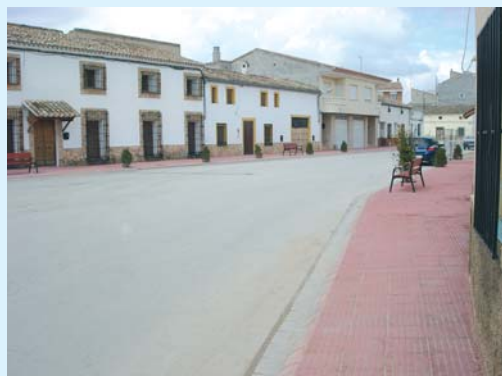
C/ Real y Plaza