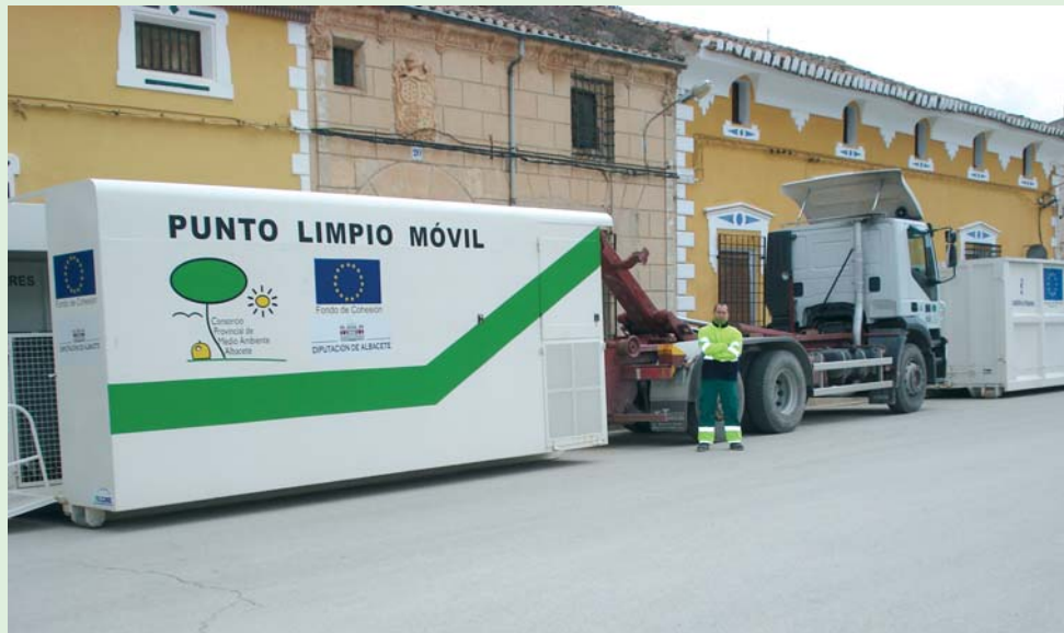
Instalado en C/ Real y Plaza