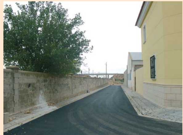
C/ Santa ana