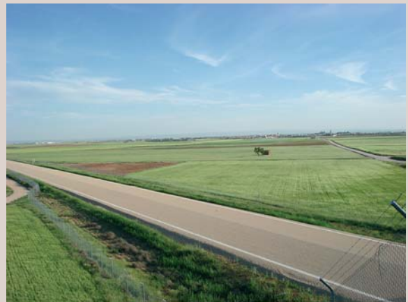
Imagen de la construcción del tramo del AVE a su paso por La Gineta.