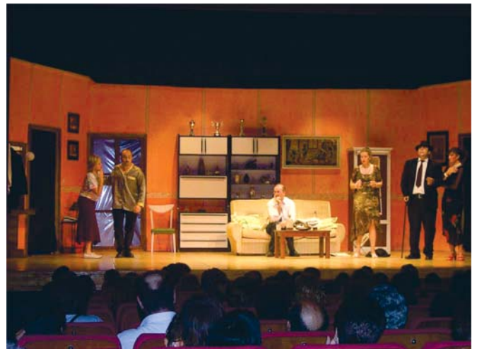
Actuación del Grupo local de Teatro "Las Cuatro esquinas".