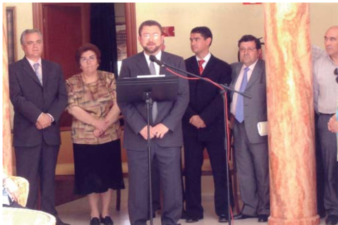
Inauguración de la Residencia de Mayores en junio 2004.