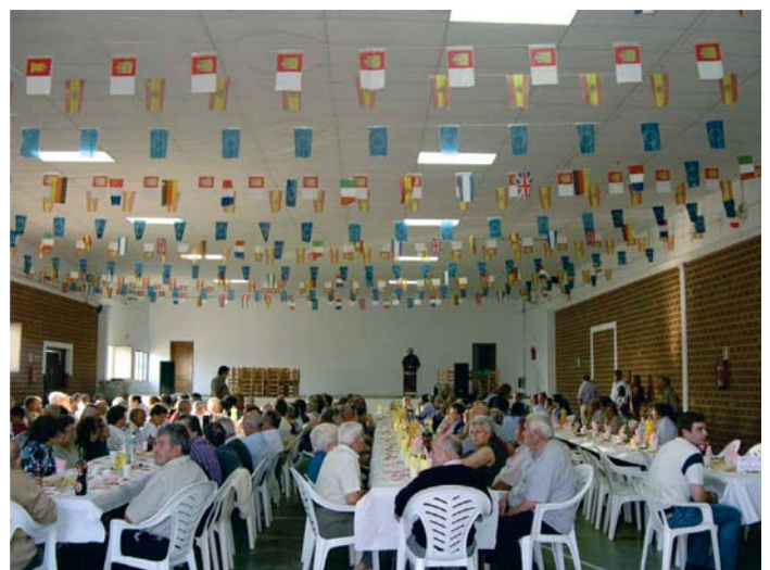
Encuentro Clubes de Jubilados