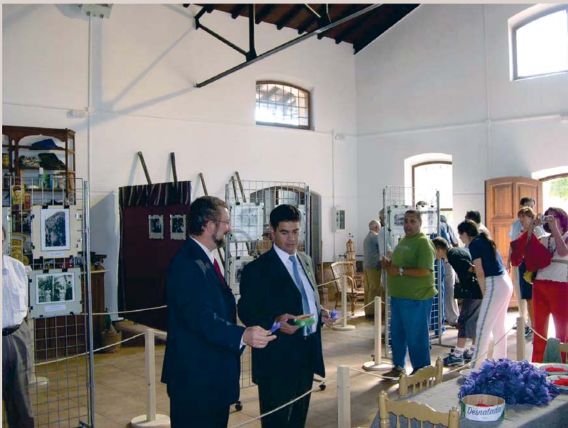
Acto de Inauguración del 13 de septiembre de 2005.