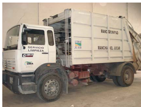
Flota de vehículos de uso municipal