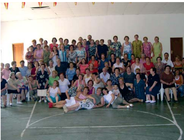
Clausura del curso 2006. Amas de casa.