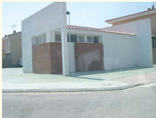
Inauguración del Centro Social en “Los Olivos” el 5 de agosto de 2006