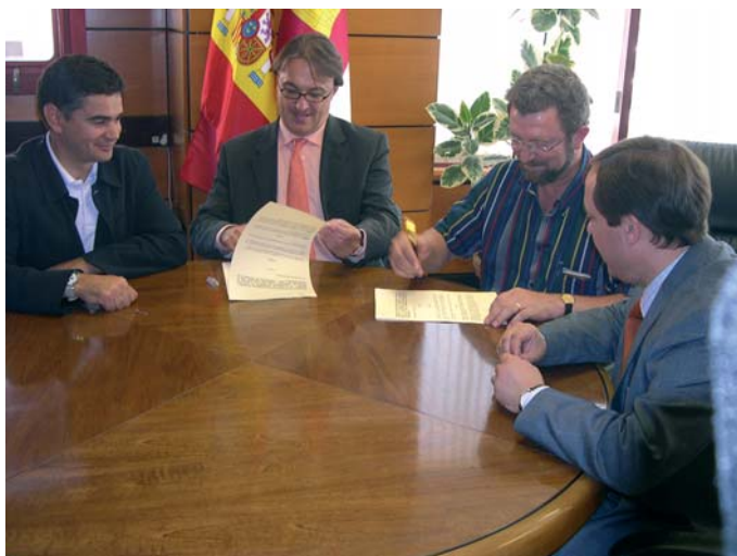
Firma del Convenio con el Consejero de Vivienda y Urbanismo