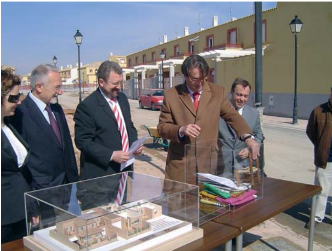
Puesta de la 1ª piedra