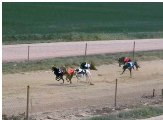
XX Campeonato de España Junio 2006.