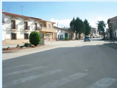
C/ Santa Ana