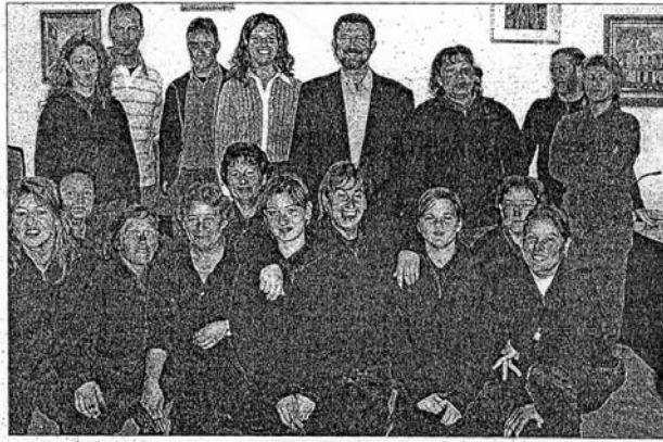
El alcalde junto a los alumnos del Taller de Profesionalización.

tes. Así mismo, pueden desarrollarse proyectos de este tipo en municipios de menos de 15.000 habitantes cuando su objetivo sea atender a sectores profesionales o económicos en crisis y con especiales dificultades para la generación o mantenimiento del empleo.