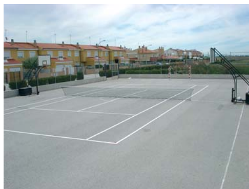
Acondicionamiento de calles, zonas deportivas y parque infantil.