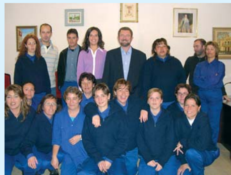
Taller de especialización profesional (TEPRO) de jardinería