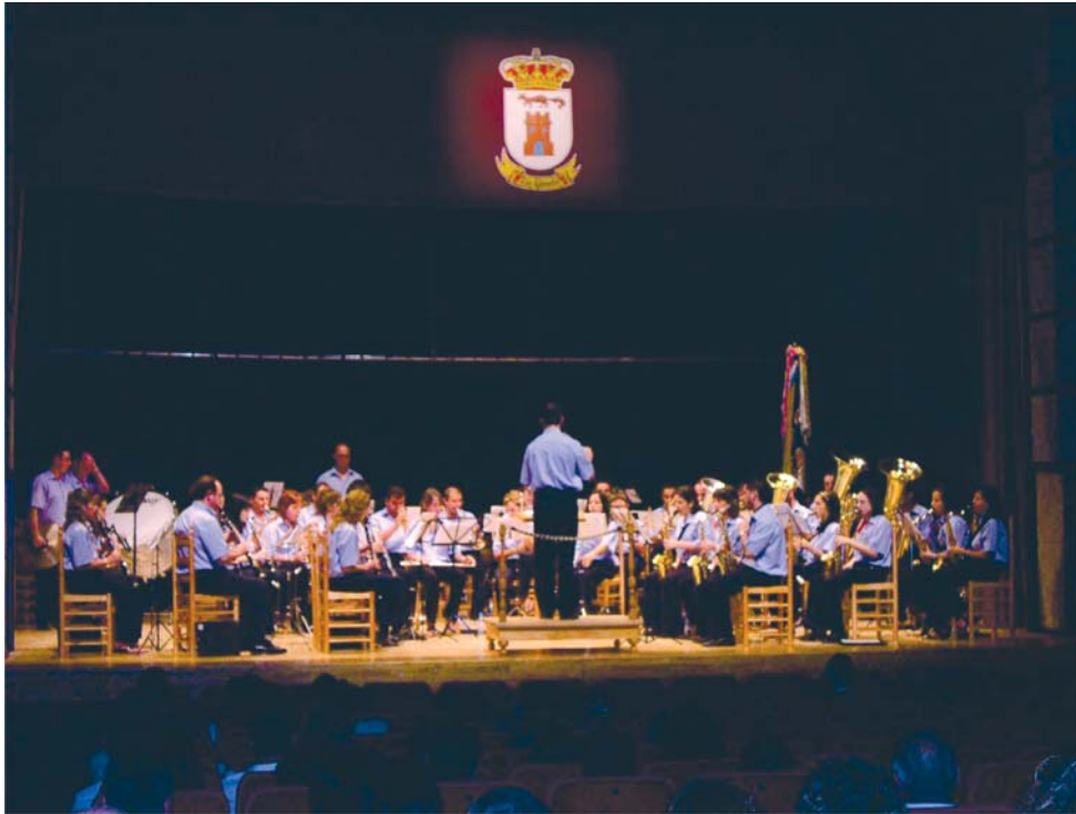
Encuentro de Badas de Música 2006 celebrado en La Gineta

Actuación de la Banda Municipal de Música en la Casa de la Cultura