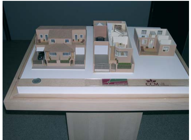
Maqueta de las V.P.O.