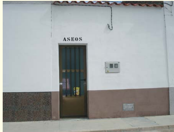
Nuevos aseos realizados en C/ Nueva