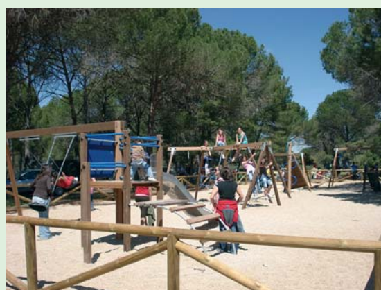
Nuevas instalaciones de ocio en “Paraje de San Isidro”